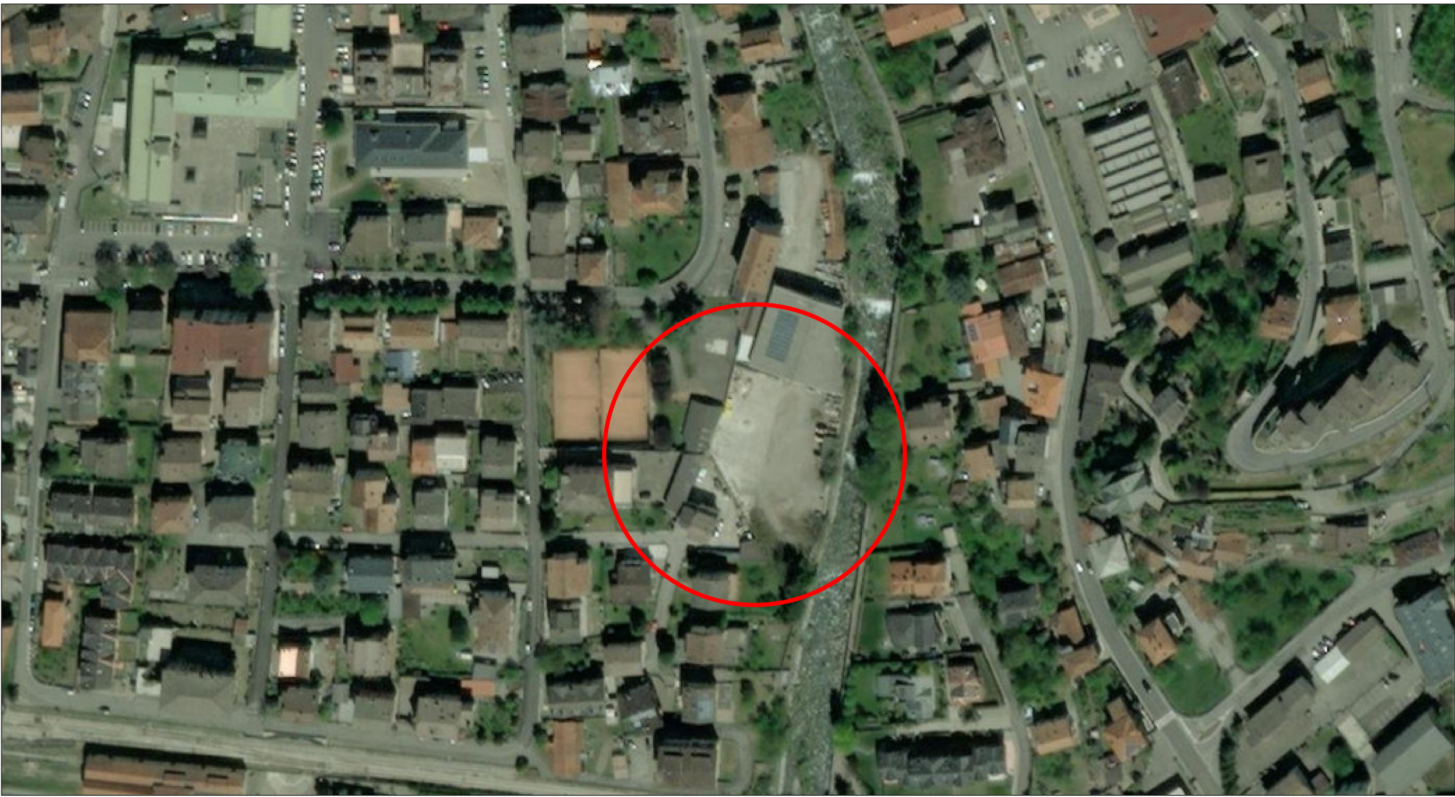
ORTOFOTO scala 1:2000